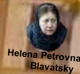
Helena Petrovna Blavatsky