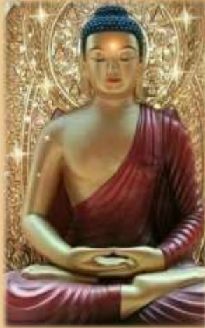
SIR E. ARNOLD

“Si estuviereis sujetos a la rueda del cambio sin que hubiese medio de romper vuestras cadenas, el corazón del Ser libre sería maldito, el Alma de las cosas sería un cruel dolor. ¡Pero no estáis atados! El Alma de las cosas es suave; el corazón del Ser tiene una paz celeste; la voluntad es más fuerte que el dolor; lo que era bueno se torna mejor, y después excelente.